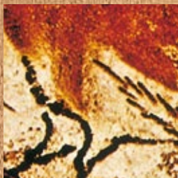
Jeskynní malby ze španělské Altamiry – již v prehistorické době se vápno používalo jako barva.

za jejich trvanlivost však nevděčíme vynalézavosti jakýchsi paleolitických expertů, nýbrž právě vápnu. Při vysychání povrchu to tiž reaktivní částice vápna reagují s oxidem uhličitým ze vzduchu a vytvářejí pevný povlak, který nerozpustně váže pigmenty. Tak vznikly tyto „přírodní fresky“.