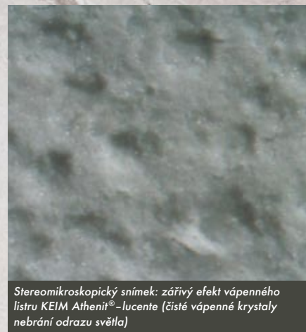
Stereomikroskopický snímek: zářivý efekt vápenného listru KEIM Athenit®-lucente (čistě vápenné krystaly nebrání odrazu světla)

Pro specifické úkoly v oblasti sanaci historických staveb se nabízí vápenná barva KEIM Athenit®-lucente, která díky tomu, že vůbec neobsahuje titanovou bělobu, vytváří nátěry se zářivým vápenným listrem. Uplatní se tak nezaměnitelný, nezastřený vzhled čistého vápna.